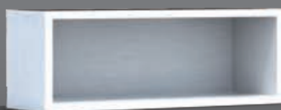
12873909 дуб беленый