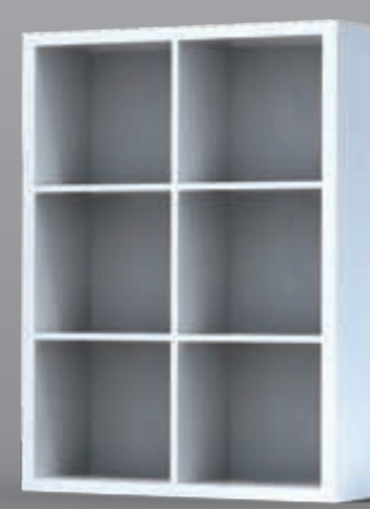
12873888 дуб беленый

Для дополнительной устойчивости составных композиций, каждый корпус комплектуется настенными «скобами крепления».