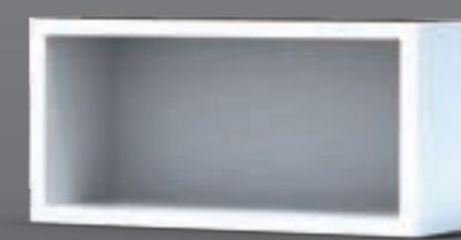
12873933 дуб беленый

3 формы фасада, 6 глянцевых цветов создадут уникальное, ваше решение