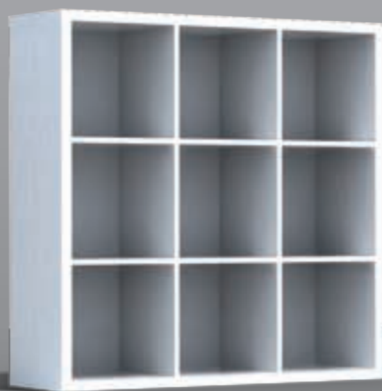
12872746 дуб беленый